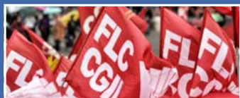
facebook FLC CGIL Reggio Emilia

I vincitori del concorso su posto comune, che vi abbiano partecipato con il requisito di 30 CFU sottoscrivono un contratto annuale a tempo determinato, e su richiesta a part-time, con l'ufficio scolastico regionale a cui afferisce l'istituzione scolastica scelta e completano il percorso universitario e accademico di formazione iniziale con oneri a proprio carico. Con il superamento della prova finale del percorso universitario e accademico di formazione iniziale, i vincitori conseguono l'abilitazione all'insegnamento e sono sottoposti al periodo annuale di prova in servizio, il cui positivo superamento determina l'effettiva immissione in ruolo.