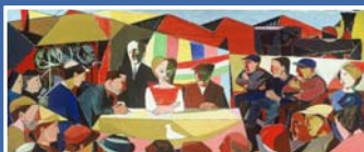
facebook CGIL Reggio Emilia